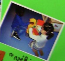
« véhicules ».