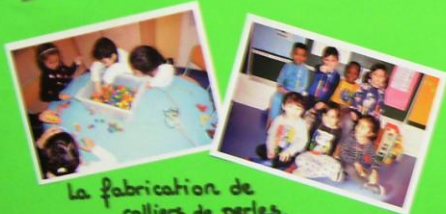
La fabrication de colliers de perles.