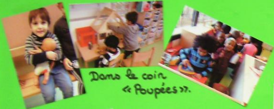
Dans le coin « Poupées ».

Dans les classes de MOYENNE SECTION, les filles et les garçons partagent les mêmes activités et jouent aux mêmes jeux :