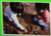
Dans le jardin.