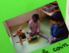
Dans le coin