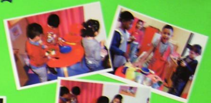
Dans la « cuisine ».